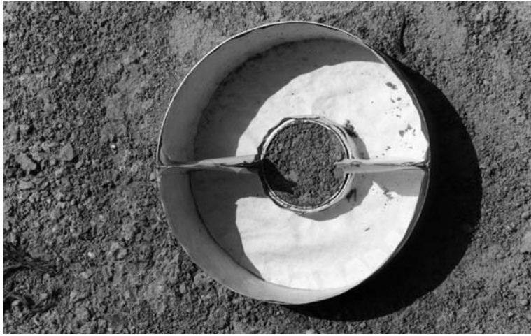
FIGURA 4: Detalle de Taza Morgan, el material depositado en el interior es precedente de la deflación eólica.

zonas de interrill la erosión está controlada por la tasa de disgregación puede dar lugar a la sobrestimación de las tasa de erosión como ya se ha señalado. Debe tenerse en cuenta que la erosión es función de la tasa de disgregación y de la variabilidad espacial de la profundidad y velocidad de la escorrentía superficial (Parsons y Abrahams, 1993). Siendo esta variabilidad la causante de la disparidad entre las tasas de erosión y las tasas de material disgregado por splash.