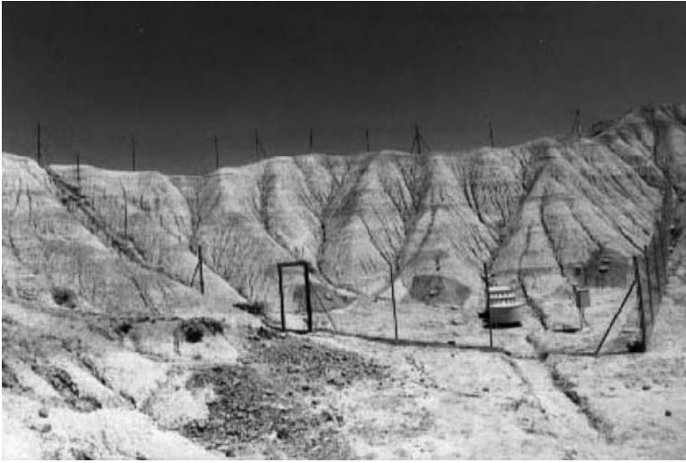
FIGURA 2: Parcela Experimental de Bardenas Reales con las Tazas Morgan dispuestas siguiendo diferentes inclinaciones y exposiciones.

(Tabla 1). Los resultados nos muestran que las tasas de erosión obtenidas son muy elevadas. Ello es debido en primer lugar al efecto de la escala Lal y Elliot, (1994), y en segundo lugar, a los errores propios del método, principalmente debidos al pesaje.