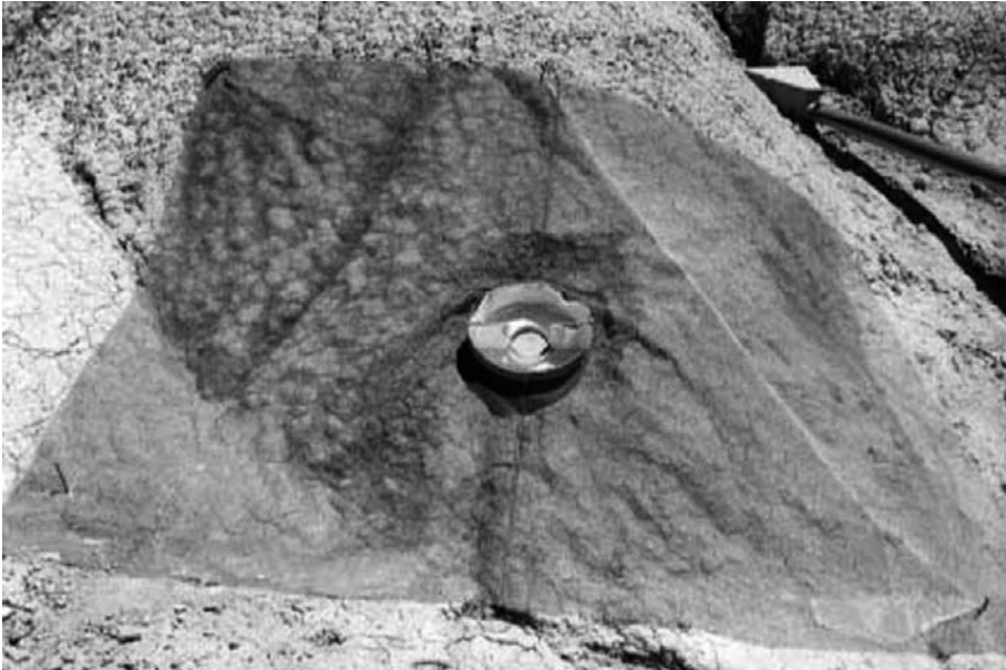
FIGURA 1: Detalle de Taza Morgan con malla alrededor.

dos mitades iguales, que se coloca perpendicular a la línea de máxima pendiente. Dado que el ángulo medio de eyección de las partículas dispersadas es de 13^\circ (Morgan, 1978, De Ploey y Savat, 1968), la configuración de la taza permite recoger tanto las partículas proyectadas a distancias menores que el radio de la cubeta, como las proyectadas a distancias mayores con ángulos inferiores a 20^\circ . El transporte se expresa en \text{gr}/\text{cm}^2 por unidad de tiempo. El splash es función de la pendiente (Mosley, 1973). Por ello se instalaron en diferentes condiciones de pendiente y exposición (Figura 2). Para contabilizar el material movilizado tanto hacia la zona superior como inferior de la ladera, se han instalado unas fundas de papel de filtro en el interior de las dos partes en que se divide la cubeta (Figura 1). Estas son pesadas y numeradas en el laboratorio previamente a su instalación en campo, de modo, que transcurrido un evento se recogen y una vez secas se pesan en el laboratorio. El peso del suelo de la cubeta ladera abajo menos el peso correspondiente al de ladera arriba nos