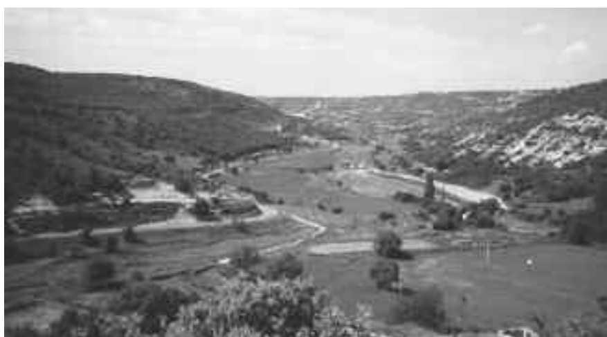
FOTOGRAFÍA 1. Aspecto del Arroyo de la Vega