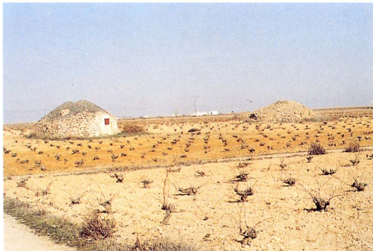
Típicos "bombos manchegos". Unidad Agroedáfica 4-5.