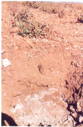
Unidad Agroedáfica 4-5. Calicata abierta para plantación de cepa.