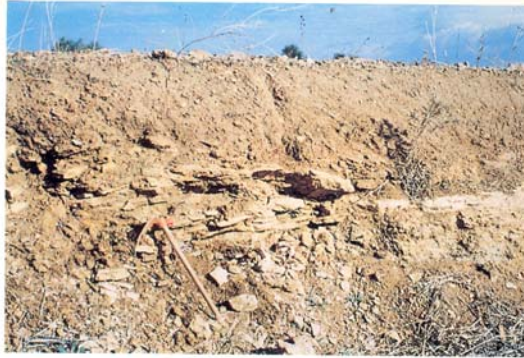
Perfil panorámico de la Unidad Agroedáfica 4-5. Detalle de la costra calcárea.