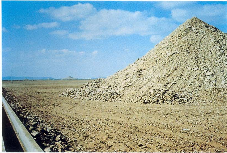
Pirámide de costra en la zona de los regadíos de Cinco Casas.