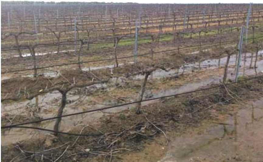
Parcela de viñedo en riego por goteo situada al sur de la calicata