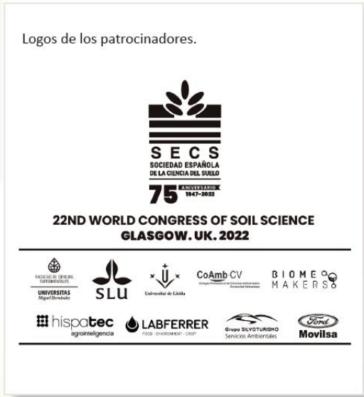
Logos de los patrocinadores.