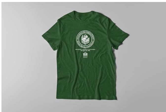
Figura 1. Diseño para camiseta

Tras los excelentes resultados de nuestros equipos en Hungría (2015) y Brasil (2018), pretendemos continuar participando en estas competiciones académicas ya que suponen una muy buena oportunidad para impulsar y divulgar la importancia de la ciencia del suelo, tanto a nivel nacional como internacional. Como en ocasiones anteriores, queremos tratar de hacerlo dando la máxima difusión y consiguiendo patrocinios para que no suponga un coste económico